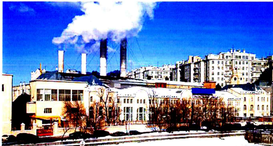
Ustanovení preferuje využití SZTE (případně zdroje postaveného SZTE naroveň) jako primárního způsobu vytápění

Vedle primárního připojení k SZTE umožňuje § 16 odst. 7 ZOO také využití jiného zdroje vytápění (který je SZTE postaven naroveň), a to za předpokladu, že takový zdroj není stacionárním zdrojem ve smyslu ZOO, tj. zdrojem, který znečišťuje nebo by mohl znečišťovat ovzduší. 2 Tím je implicitně vyjádřen právě zájem na lokální ochraně ovzduší, kdy zákon výslovně připouští, aby fyzické a právnické osoby namísto tepla ze SZTE využily i jiný způsob vytápění, avšak za podmínky, že při jeho provozu nedojde ani k potenciálnímu znečištění ovzduší. 3 Dikce § 16 odst. 7 ZOO tak kromě SZTE zjevně připouští i použití zdrojů, které k výrobě tepla využívají elektrickou energii (neboť při jejich provozu nedochází ke znečištění ovzduší na lokální úrovni). Podle důvodové zprávy k ZOO je tímto ustanovením bez dalšího připuštěno také využití obnovitelných zdrojů energie, u kterých nedochází ke znečišťování ovzduší v místě jejich provozu (tepelná čerpadla, solární panely atd.). 4